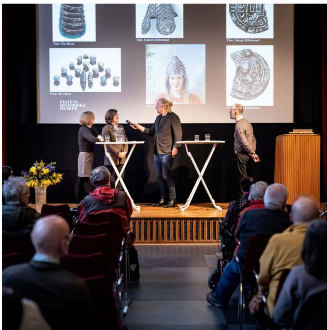
Liveinspelning med Vetenskapsradion Historia 24 februari 2023.

Forskningsprojektets syfte är att lyfta fram detta material samt undersöka hur samlingarna använts historiskt och hur de kan påverka nationella identiteter och uppfattningar. Att belysa dessa sammanhang är särskilt viktigt i en tid då det ukrainska kulturarvet är hotat, både av den ryska statliga ideologin och den militära invasionen.