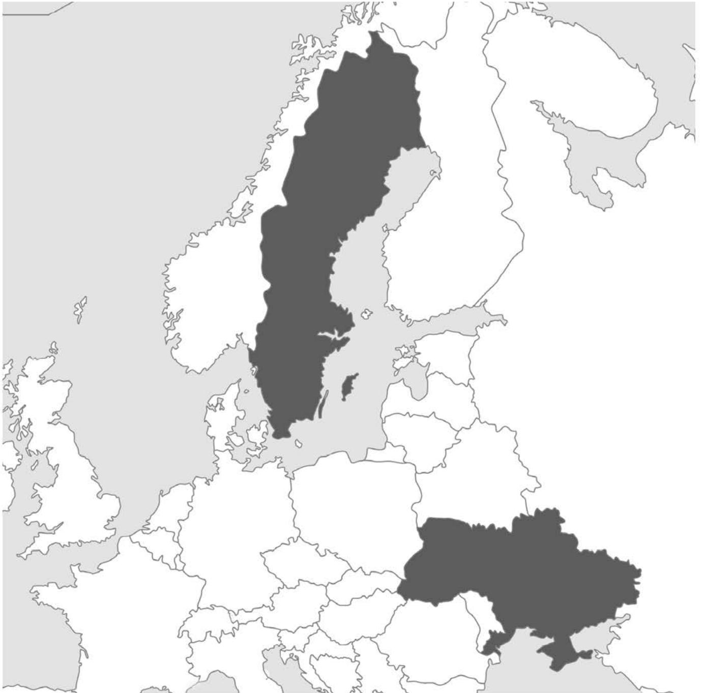
Karta över Europa som visar Sverige och Ukraina.

Under våren 2023 kan du se utställda föremål som visar på historiska kopplingar mellan Sverige och Ukraina. Visas till och med 3 september 2023.